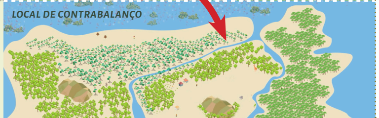
LOCAL DE CONTRABALANÇO

Um contrabalanço de biodiversidade é uma acção de conservação numa determinada área fora da pegada do projecto, que tem como objectivo melhorar um tipo particular de biodiversidade, gerando resultados mensuráveis que vão contrabalançar os impactos sobre o mesmo tipo de biodiversidade na área impactada.