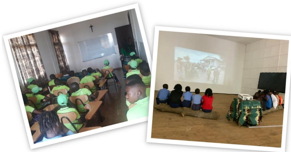
Legenda: Sessão de Filmes sobre Biodiversidade.

Projecção de filmes – foram criadas salas de projecção de filmes no local da exposição e nos centros de acomodação dos estudantes dos jogos escolares, composta por um leque de filmes sobre a biodiversidade de Moçambique com destaque para os filmes recentes sobre a Reserva Nacional de Chimanimani e sobre o Parque Nacional de Gorongosa, bem como sobre o Turismo em Manica e alguns filmes produzidos por parceiros da WildAid e WWF.