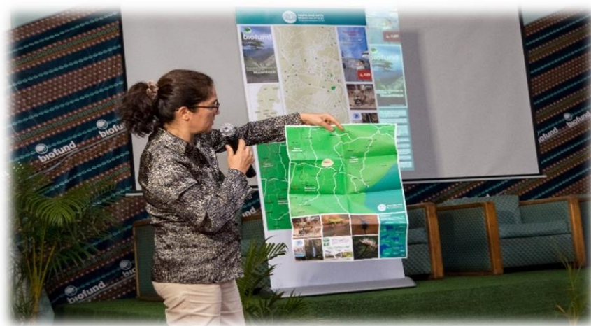
Legenda: Apresentação do Mapa das Artes

O evento contou igualmente com a apresentação do Mapa das Artes de Manica, uma actividade que iniciou na Exposição de Biodiversidade de Inhambane com o lançamento do Mapa das Artes de Inhambane. O Mapa das Artes é um guia que retrata o potencial turístico e cultural das províncias em que está presente. Procurou-se para o Mapa das Artes de Manica agregar informações sobre a dimensão da biodiversidade local. Foram distribuídos cerca de 1000 mapas em diversos locais tais como, Aeroporto, hotéis, Município de Chimoio, Universidades e instituições parceiras (EcoMicaia, Ndzou Camp e Reserva Nacional de Chimanimani).